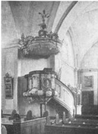
Die Rokoko-Kanzel der Tragheimer Kirche Sie wurde 1784 von dem Königsberger Tischlermeister Grabowski mit feinem Stilgefühl geschaffen.

Aus Scheunen werden Kirchen. Es dünkt uns ein Erlebnis unserer Gegenwart allein, dass allerlei Gebäude weltlicher und unwürdiger Art, dem entstandenen geistlichen Verlangen entsprechend, zu Kirchen aus- oder umgebaut werden: Baracken und Bunker, Kasernen und Trümmerhäuser verwandeln sich in Stätten der Anbetung. Dann und wann geschah das aber auch in längst vergangenen Zeiten. Wer durch das Königsberger „Geheimratsviertel“ ging, welchen volkstümlichen Namen der Tragheim vor fünfzig Jahren noch mit Recht trug, und an der Tragheimer Kirche vorbeikam, konnte nicht ahnen, dass als erstes Gotteshaus dort eine Ziegelscheune diente. Im Jahre 1624 ging sie durch Kauf aus der weltlichen Verwaltung in die kirchliche über. Der zur Ziegelherstellung dienende Lehm war abgegraben; sie konnte also nicht weiter verwendet werden. Und auf der anderen Seite wurde ein Friedhof gebraucht und eine dazugehörige Kapelle. So diente jenes unbrauchbar gewordene und wahrscheinlich auch nicht ansehnliche Gebäude den Bewohnern der „Freiheit“, wie damals auch der Tragheim genannt wurde, wenn sie sich zu Trauerfeiern anlässlich der Bestattung ihrer Angehörigen dort zusammenfanden. Aber schon zwölf Jahre später wurde aus der Friedhofskapelle eine Gemeindegkirche.