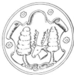
Das Wappen der Fürstlichen Freiheit Tragheim